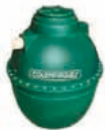
⑥ Tanque para tratamiento de aguas grises 250 L / 500 L / 1000 L / 2000 L