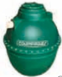
③ Pozo séptico Imhoff ovoide 500 L / 1000 L / 2000 L