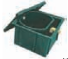
① Trampa de grasas Cuadrada 95 L Ovoide 250 L / 500 L 1000 L / 2000L