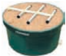
⑤ Tanque filtro aeróbico 500 L / 1000 L / 2000 L