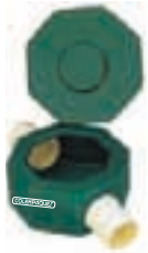
② Caja de inspección y distribución Pequeña / grande