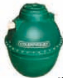
④ Tanque filtro anaeróbico 500 L / 1000 L / 2000 L