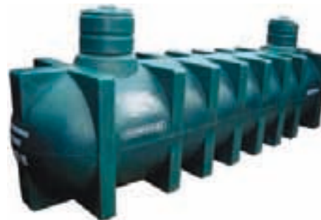
Tanque séptico horizontal Con cuellos extensores opcionales 4000 L