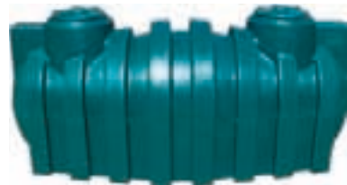
Tanque séptico horizontal 2000 L